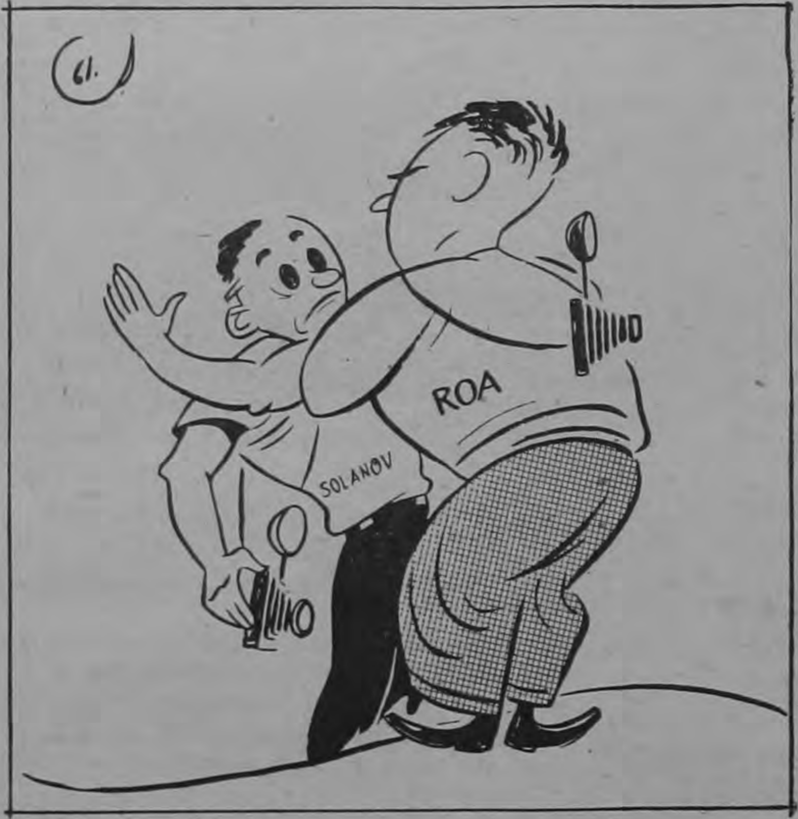
—Si vieras lo que yo tengo en Colombia, pero viejo, vivimos en una democracia... (La Reina Isabel otorgó el título de Conde al ex-fotógrafo que logró casarse con su hermana la Princesa Margarita).